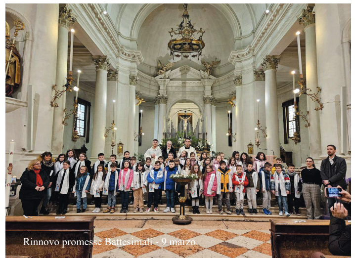
Rinnovo promesse Battesimali - 9 marzo