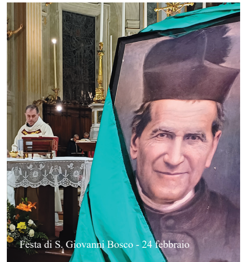
Festa di S. Giovanni Bosco - 24 febbraio