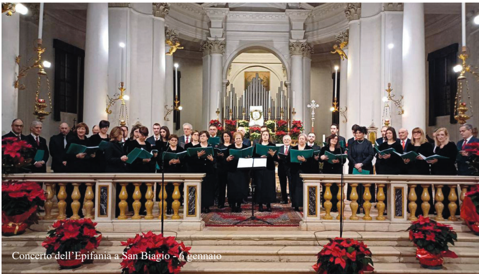
Concerto dell'Epifania a San Biagio - 6 gennaio