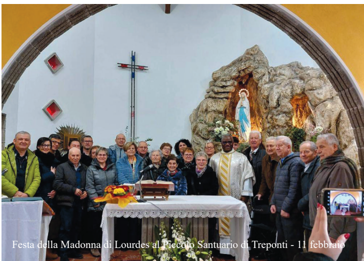
Festa della Madonna di Lourdes al Piccolo Santuario di Treponti - 11 febbraio